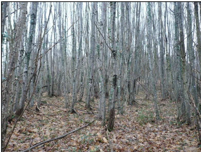
PHOTO 1. — Taillis simple de châtaignier marqué en vue d'un balivage en Haute-Vienne

On désignera par « taillis simple » tout « peuplement forestier issu de rejets de souches ou de drageons dont la perpétuation est obtenue par des coupes de rajeunissement » (Bastien et Gauberville, 2015). Les tiges sont coupées la même année et les souches rejettent toutes la même année.