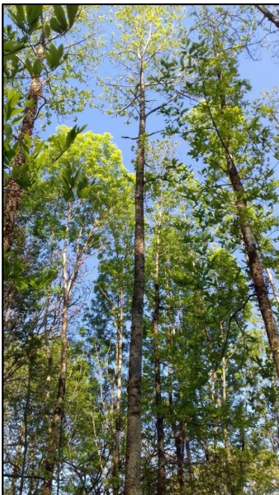
PHOTO 3. — Magnifique châtaignier issu du balivage ; il s'agit de la seule tige restante sur la souche. Pour désigner le peuplement, on peut désormais parler de futaie sur souches

On désignera par « futaie sur souches » un peuplement forestier feuillu issu du vieillissement ou de la régularisation d'un taillis (par balivage intensif), comportant une forte proportion de tiges issues de rejets de souches et ayant l'aspect d'une futaie.