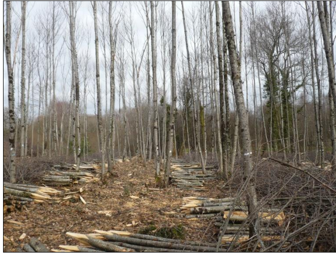
PHOTO 2. — Taillis de châtaignier après l'opération de balivage

Dans la suite, on parlera de « balivage » pour désigner l'éclaircie d'un taillis simple en vue de le convertir en « futaie sur souches », au profit des plus belles tiges appelées « baliveaux » préalablement sélectionnées grâce à un martelage ou un marquage.